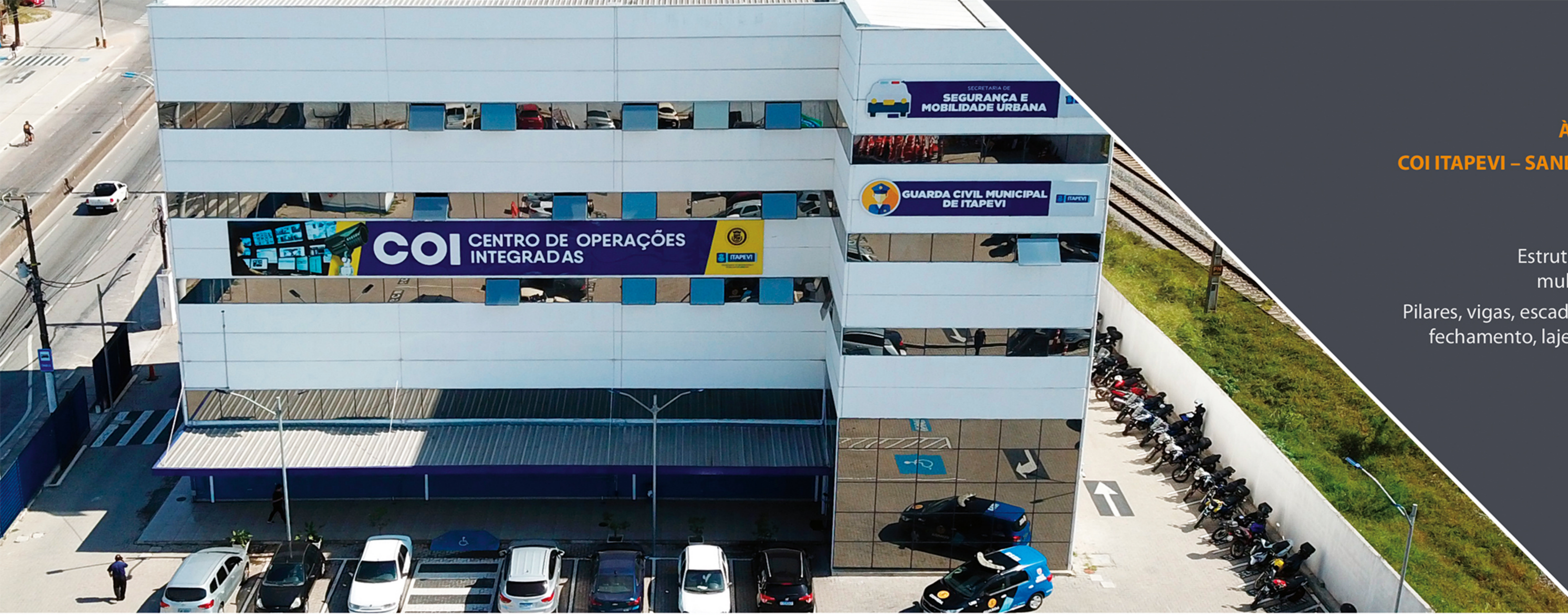
À ESQUERDA: COI ITAPEVI – SANDRO CALIARI Itapevi, SP 1.952 m 2 Estrutura comercial multipavimentos Pilares, vigas, escadas, painéis de fechamento, lajes e cobertura